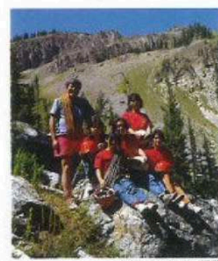
ネイチャースクールの活動

● クリエイティブ・インバイラメント・インスティテュート財団 モンタナ州ビーバーズプリングスに設立されるハマノ・ネイチャースクールを支援する財団。当校は、子供たちの感性を開き、創造的な人間に育つよう、自然の中で活動する学校。